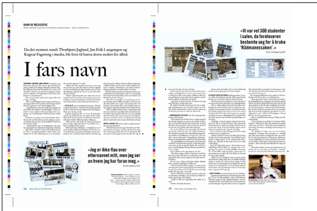
Faksimile 23 Faksimiler av Dagbladets Magasinet (25.10.03) som illustrerer hvordan disse blir nyttet i estetisk øyemed på de to sidene for å forklare bakgrunnen for at barna ble påvirket da det stormet rundt fedrene deres.

Et estetisk siktemål lå nok også til grunn for å bruke faksimilene (22) hentet fra Klassekampens artikkel om kontaktannonser i magasindelen av en lørdagsutgave.