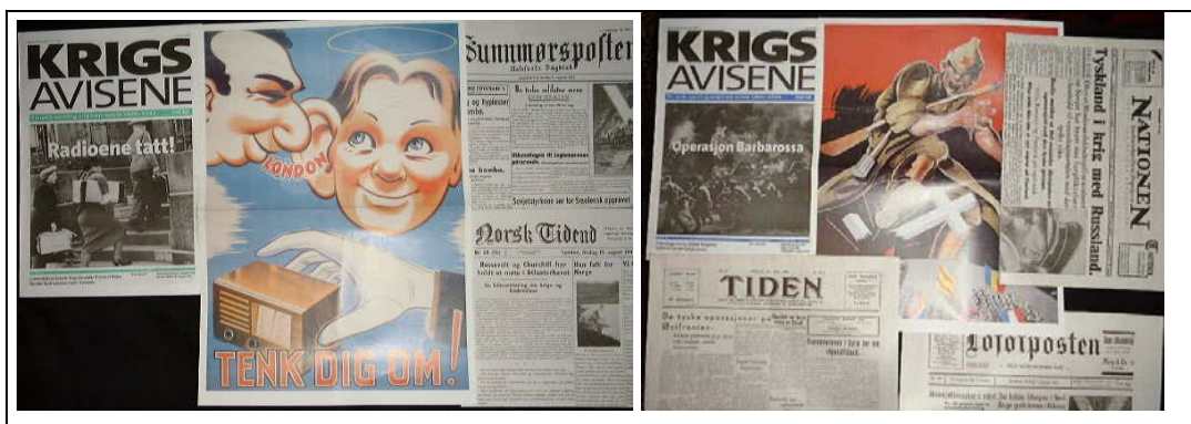
Faksimile 1 To faksimilesamlinger av de såkalte krigsavisene fra 1940-45, og redigert av Eric Scobie i 2000, og solgt i Narvesen. De er også tilgjengelig: http://krigsavisene.com/index.htm

Det hører til sjeldenhetene at det blir trykket faksimiler av aviser, slik at de kan utgis på nytt. I 2000 ble det imidlertid trykket faksimiler av de såkalte krigsavisene, og disse er fortsatt i salg hos Narvesen. Rett etter andre verdenskrig ble det også publisert faksimile-bøker som ble solgt for å markere slutten av krigen og frigjøringen av Norge.