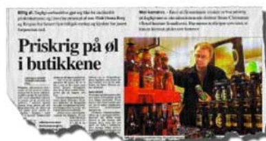
Priskrig i butikkene. Aftenpostens oppslag i går.

– Det er beklagelig at prisen på øl går ned. Vi vet at senkede priser fører til økt forbruk. Det er ikke hva vi ønsker, sier Schou etter at Aftenposten i går kunne fortelle at bryggerier og dagligvarehandel nå senker marginene for å kunne