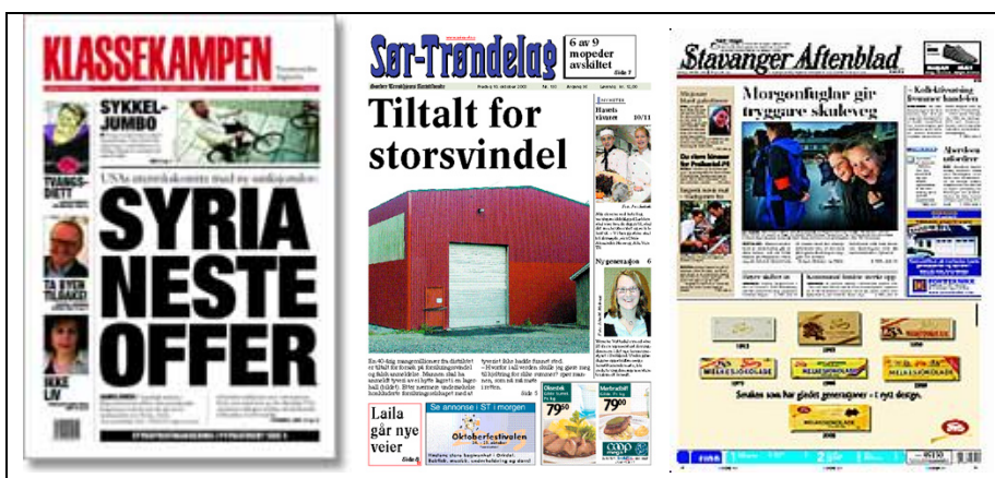
Faksimile 17 Tre faksimiler av Klassekampen , Sør-Trøndelag og Stavanger Aftenblad

som kan betales for og hentes ned på en lokal pc og leses på skjermen eller trykkes ut i A4-format i Norge og ellers i verden samtidig. For denne sørvisen til leserne er det etablert firmaer der buyandread.com har dette som et nisjeprodukt de selger til avisene. Pr i dag betjener dette dotcom-selskapet om lag tretti norske aviser.