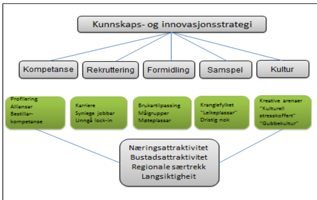
Figur 1- tema og struktur

Målet med å sette fokus på dei fem temaområda er å arbeide langsiktig for auka næringsattraktivitet, bustadsattraktivitet og å utnytte regionale særtrekk.