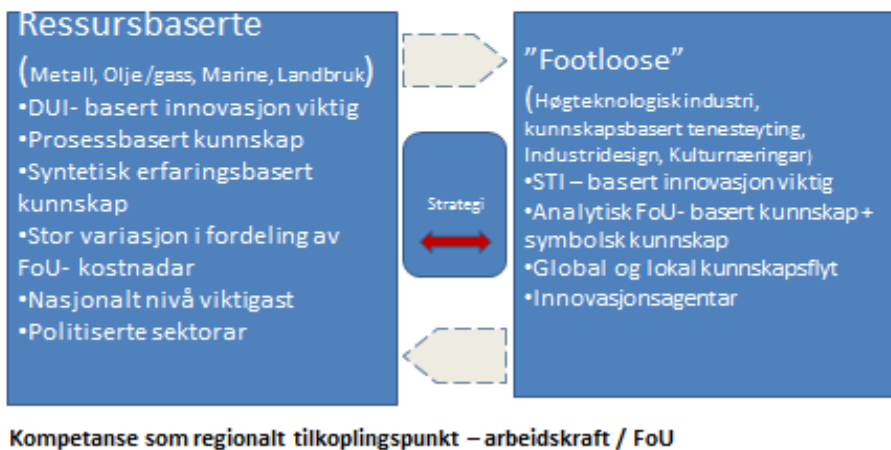
Figur 2- Ulikt kunnskapsbehov

Framveksten av eit meir kunnskapsintensivt næringsliv inneber meir spesialisering. Dei fleste bedrifter og organisasjonar har behov for å innhente komplementære ressursar utanfrå i gjennomføringa av eigne innovasjonsprosessar. Dei som lykkast klarer å utnytte den kunnskapsflyten og dialogen som finn stad mellom krevjande kundar og bedriftene, med å utvikle og utnytte den spissa kunnskapen og dialogen med kunnskapsmiljøa. Nettverk og relasjonar mellom aktørar - være seg mellom bedrifter og næringer, eller med utdannings- og FOU-miljø, er vesentleg både for utvikling av tillit og spreiding av kunnskap. Slik kontakt og samarbeid med andre utviklar gjerne evna til å reflektere og lære av både eigne og andre sine strategiar og handlingar. Det er såleis viktig med sosiale og institusjonelle nettverk knytt både opp mot marknaden, mot leverandørane og dessutan mot andre produsentar anten dette er konkurrentar eller andre når omstilling og nyskaping finn stad.