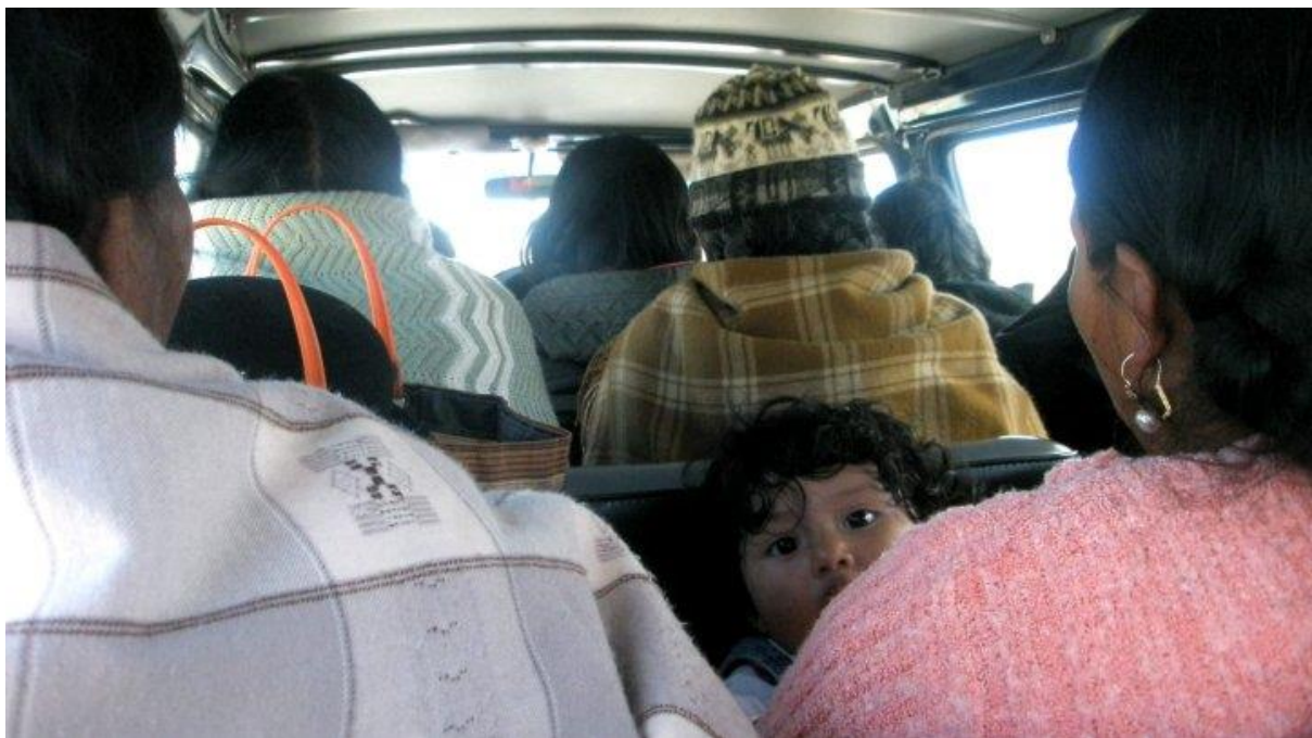
(På veg til El Alto med minibuss, det billigaste alternativet for kollektivtrafikk.)

Denne prosessen byrja for fullt då eg var tilbake i Noreg etter feltarbeidet, men var også noko eg arbeidde med undervegs i feltarbeidet. Målet med dataanalysen er som kjent å gi eit innblikk i kulturmøter som vert skapt gjennom Misjonsalliansens HIV/Aids-prosjekt, og korleis dei involverte partane opplevde desse. Ved hjelp av innsamla data frå observasjonar og intervju har eg tolka og samanfatta desse. Eit viktig ledd i prosessen med handsaminga av data var at eg måtte omsetje ein del tekst frå spansk til norsk, noko som var meir tidkrevjande enn eg hadde førestilt meg. Nokre gonger har eg følt at innsamla data ikkje var tilstrekkeleg for å forklare spesielle fenomen, og eg har difor også nytta litteratur for å belyse enkelte fenomen på ein betre måte. Litteratur har også vore med på å gi meg ei betre forståing av mine egne innsamla data.