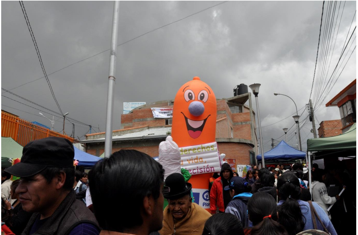
(Ein smilande kondom vart dagens blikkfang under markeringa av verdas aidsdag på El Alto. Biletet er teke like før uvêret byrja.)