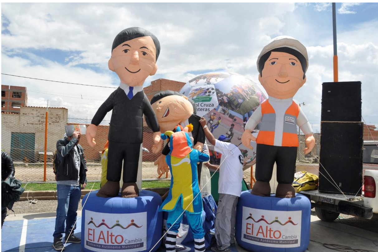
(Lufta gikk ut av ein oppblåsbar Evo Morales (i midten) under opninga av volleyballbana på El Alto. På si høgre side har Evo ordføreren, medan på venstresida står visepresident Alvaro.)

Eksempelvis nemner utsendingen også at på same måte som Misjonsalliansen viser respekt for lokalbefolkninga ved å vere med på tradisjonelle ritual, viser også lokalbefolkninga respekt ved å unnlate å inkludere alkohol i arrangementa (noko som den norske utsendingen meiner kanskje kan bli teke fram etter at arrangementet er over og Misjonsalliansens representantar er reist). Alkohol var ein stor del av samtlege feiringar eg var med på under mitt opphald i Bolivia, og som tidlegare nemnd er dette ofte ein viktig del av ulike ritual hjå aymarafolka.