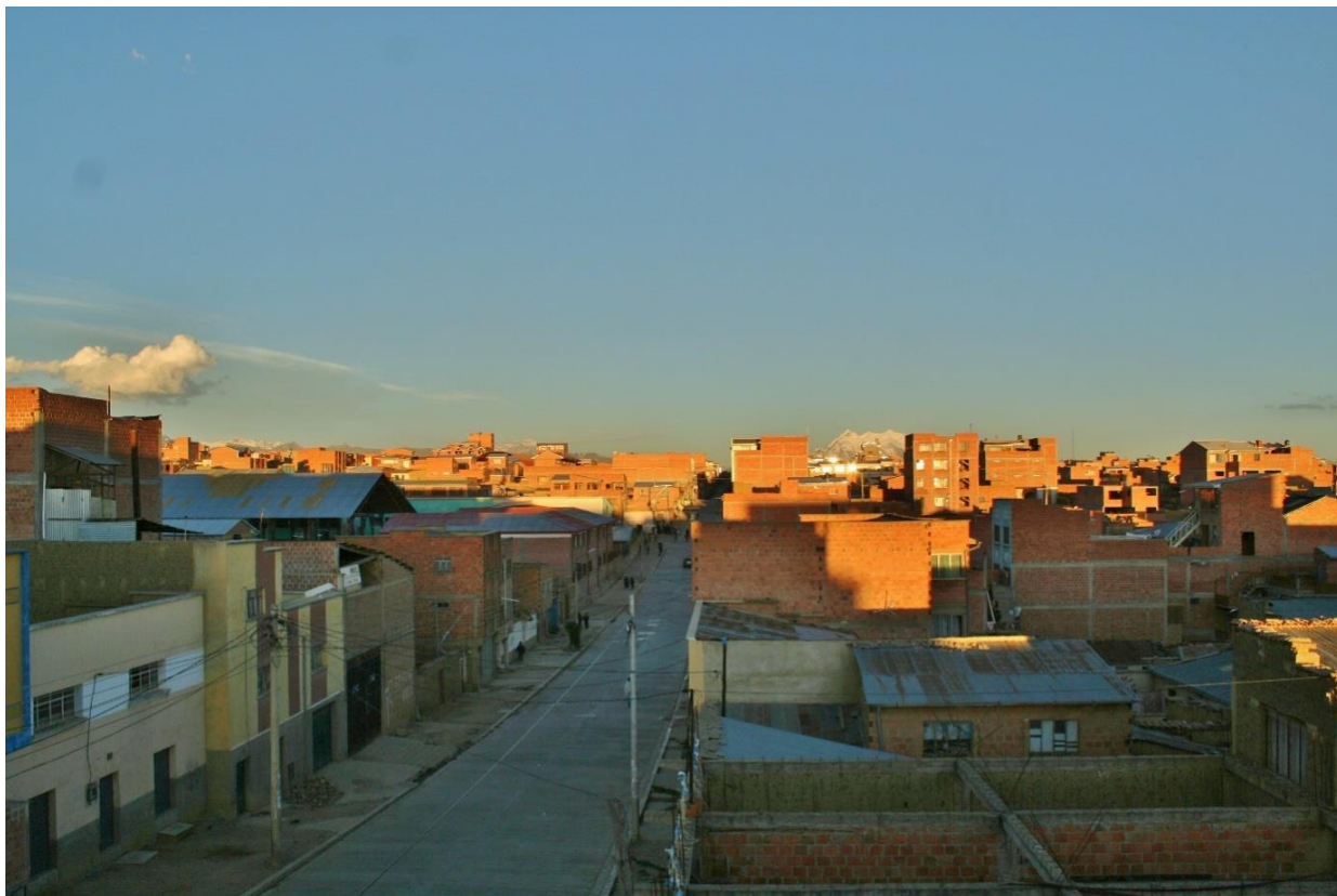
(Solnedgang over dei ytre sonene på El Alto, med Illimani (6438 moh.) i bakgrunnen.)