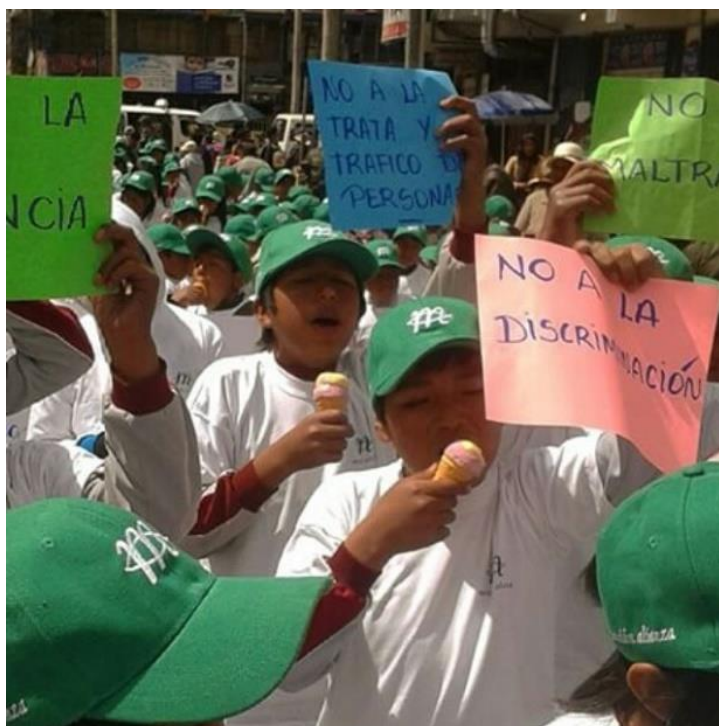
(Synleggjering av organisasjonen i lokalsamfunnet: Unge, is-etande demonstrantar frå lokale barneskular med Misjonsallianse-caps og heimelaga plakatar under ein demonstrasjon for barns rettar i gatene på El Alto.)