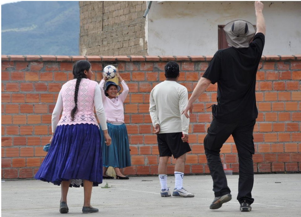
(Fotballkamp mellom norske utsendingar og deler av lokalbefolkninga i eit av prosjektområda utanfor El Alto.)

Då MAN-B sine tilsette fortalde meg om samarbeidet med lokalbefolkninga, var det som regel aymarafolka det var snakk om, sidan dei som nemnd utgjer majoriteten av befolkninga på El Alto. Det var stort sett dei norske utsendingane som uttalte seg rundt dette, for dei bolivianske tilsette var det å snakke om lokalbefolkninga som å snakke om «sine egne», sidan dei fleste sjølv bur på El Alto. MAN-B sine tilsette la heile vegen vekt på at kulturtilpassing, tillit til lokalsamfunnet, fokus på eit godt samarbeid, språk og kulturkjennskap har vore viktige strategiar i møte med lokalbefolkninga.