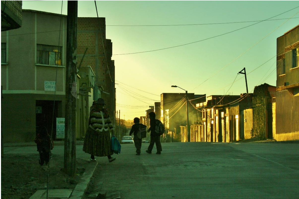
(Kveld på El Alto.)

Hensikta med denne oppgåva har vore å sjå nærmare på kva slags kultur møte som vert skapt gjennom Misjonsalliansens HIV/Aids-prosjekt på El Alto, og kva desse møta kan fortelje om religionen sine roller i norsk misjonsrelatert bistandsarbeid i dag. Gjennom dei føregående skildringane av mitt feltarbeid hausten 2014 har eg forsøkt å gi eit innblikk i dette.