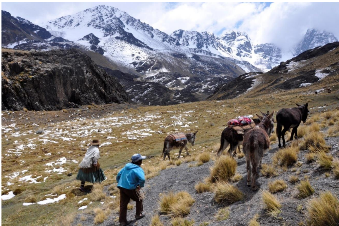
(Fleire av bøndene på Altiplano ser seg nøyddde til å trekke mot byane i håp om å skaffe seg arbeid. For mange kan dette vere ein vanskeleg overgang.)

Fjella ser også ut til å vere det einaste som kan hindre byens vidare vekst, som i dag blir rekna for å vere den raskast vaksande, ein av dei yngste, men også den fattigaste byen i Bolivia. El Alto er for mange eit attraktivt område sidan byen ligg tett på La Paz, staden der landets regjeringssete har sin plass, og som mellom anna hyser president Evo Morales. La Paz er difor ein av Bolivias viktigaste og største byar, og legg dermed til rette for at El Alto også spelar ei viktig rolle, sidan byens plassering gjer den til eit viktig knutepunkt for transport og turisme. Svært mange menneskje reiser difor dagleg gjennom El Alto. For om lag hundre år sidan var ikkje El Alto anna enn ein togstasjon og nokre varehus, medan dagens målingar viser at ein snart kan kalle det tidlegare «ingenmannslandet» for ein millionby. Nye målingar viser at El Alto no har fleire innbyggjarar enn La Paz. Den enorme befolkningsauken skuldast mellom anna dårlege levekår på landsbygda, og menneskje frå dei kringliggande bygdene strøymar til i hundretal med eit håp om å kunne skape ei betre framtid for seg sjølve og sin familie. 4 For mange blir det ein vanskeleg overgang, og som ein konsekvens av dette har ein sett ein auke i kriminalitet, prostitusjon og rusmisbruk.