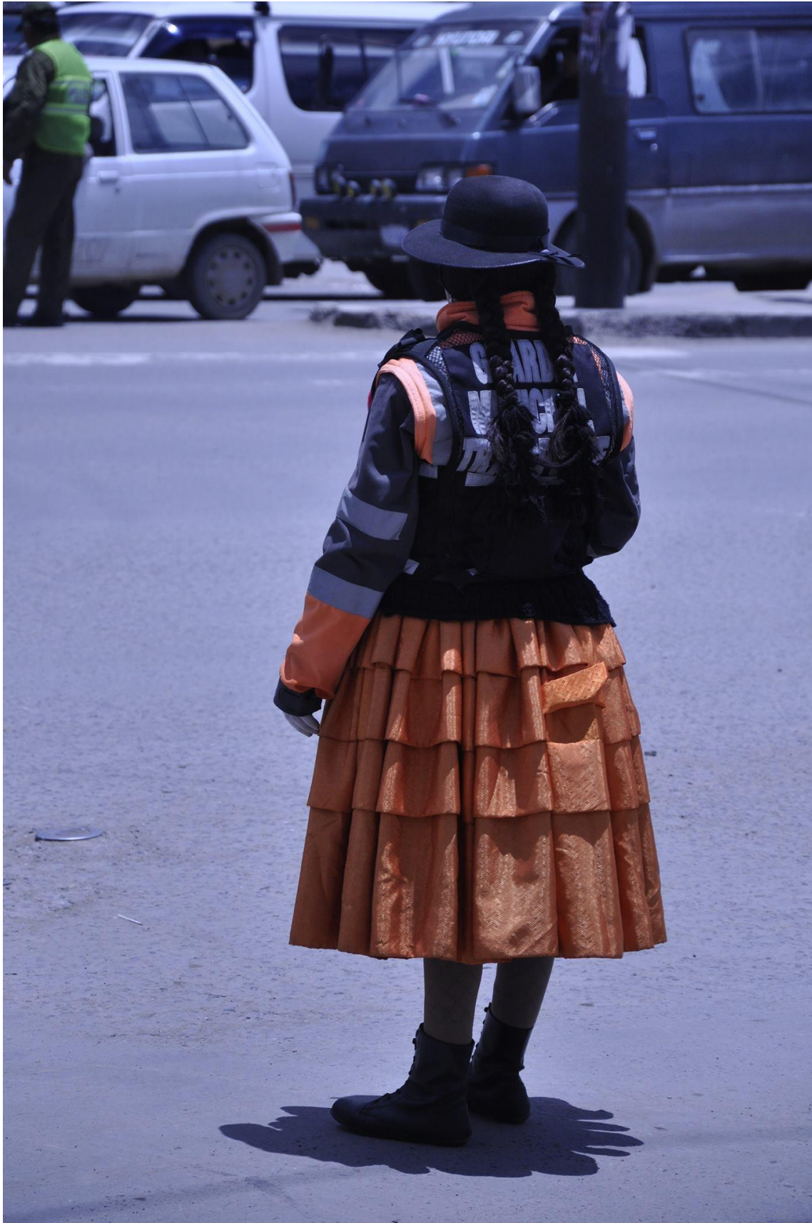
(Politikvinne på El Alto.)