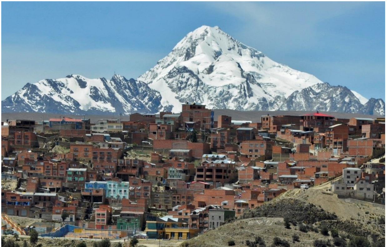
(Delar av El Alto med Huayna Potosi (6088 moh.) i bakgrunnen.)

I byrjinga av september hausten 2014 tok eg flyet frå Gardermoen, og nokre titals timar seinare var eg om bord på siste flyet, på veg ned mot El Alto og verdas høgstliggande internasjonale flyplass på 4100 meter over havet. Byen byrja snart å kome til syne mellom skylaget, og det er ikkje til å stikke under ein stol at det kribla i magen då eg kunne sjå at vi nærma oss. Tankane vandra mot feltarbeidet eg hadde framføre meg. Kva kunne eg egentleg forvente å få til på tre månader? På førehand hadde eg ikkje avtalt noko anna enn at eg skulle ha feltarbeid, men ante framleis ikkje kva eg skulle gjere undervegs i det. Den norske utsendingen som eg hadde vore i kontakt med, meinte vi heller burde ta det då eg kom til Bolivia, slik at dei bolivianske tilsette også fekk vere med på den prosessen. «Vakkert, ikkje sant?», spør ein av mine bolivianske medpassasjerar, og distraherer meg frå mine eigne tankar. Eg kunne ikkje anna enn å seie meg einig. Ovanifrå er El Alto eit massivt syn, og byen utgjer eit skilje mellom dei mektige Andesfjella i aust og vest, med sine snøkleddedde tindar som strekker seg til himmels. El Alto ligg på den nordlege delen av Bolivias Altiplano, ei vidstrakt høgsllette i Andesregionen som dekker store områder frå Titicacasjøen i aust til Peru i nord, og vidare til den argentinske semiørkenen i sør. Her når fleire av toppane opp til 6000 meter over havet, og tusen høgdemeter lågare ligg beiteområda til både lama og alpakka.