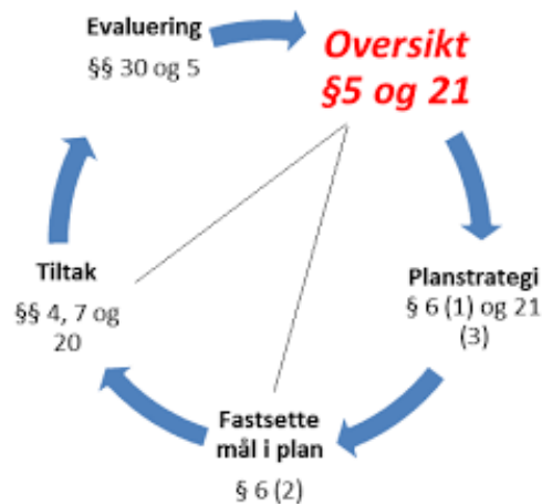
Figur 2. Det systematiske folkehelsearbeidet

på opplysningar og data som er samla både gjennom kvantitative og kvalitative metodar. Elementa og logikken i det systematiske folkehelsearbeidet er skissert i figuren som følgjer.