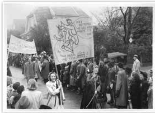
En kvinneløst 17. mars 1945.

«Også dette var ein del av «Stavanger i Fest», og for den del: Norge i fest. Tusener av kvinner vart mishandla av tusener av menn. Det helle vart applaudert av hundretusener gode nordmenn, og vi var ikkje aleine. Det skjeddte over heile Europa.