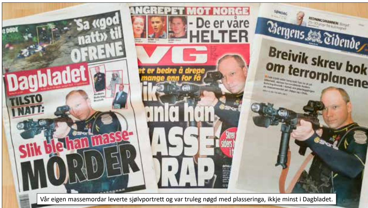
Vår eigen massemorðar levte sjølvportrett og var truleg nøgd med plasseringa, ikkje minst i Dagbladet.