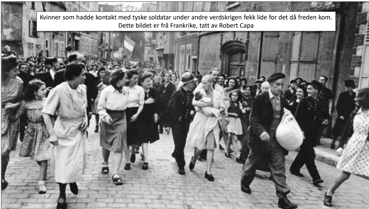
Kvinner som hadde kontakt med tyske soldatar under andre verdenskrigen fekk lide for det då freden kom. Dette bildet er frå Frankrike

18 Journal of Peace Studies / Journal of Peace Studies