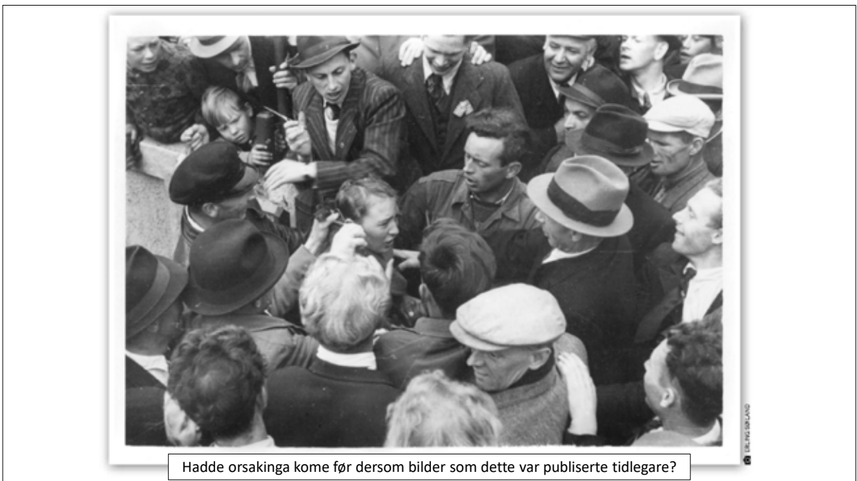
Hadde orsakinga kome før dersom bilder som dette var publiserte tidlegare?