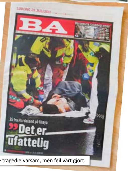
Med nokre unntak var bildebruken rundt vår store tragedie varsam, men feil vart gjort.