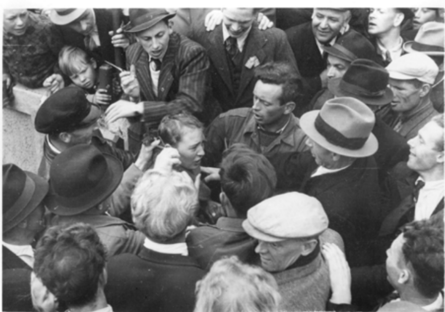
Dette bildet vart publisert utan sladding for første gong den dagen.

Sju månader seinare bad den norske regjeringa om orsaking for dei overgrep, ulovlege fengslingar, tap av statsborgarskap og deportasjon som tusener av norske kvinner vart utsette for våren og hausten 1945.