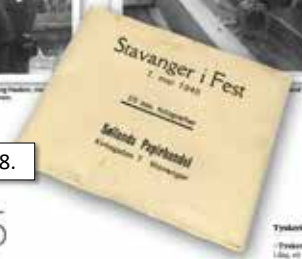
Desse fotomina frå fredsfeiringa vart presentert i Stavanger Aftenblad 17. mars 2018.