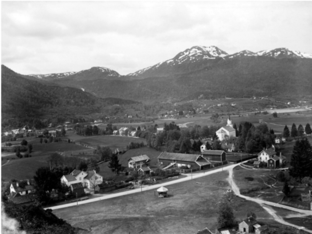
Figur 4. Førde ca. 1905-1944. Vi ser kyrkja med gardane Svei og Førde prestegard nærmast og Hafstad og Halbrend lenger vekk.