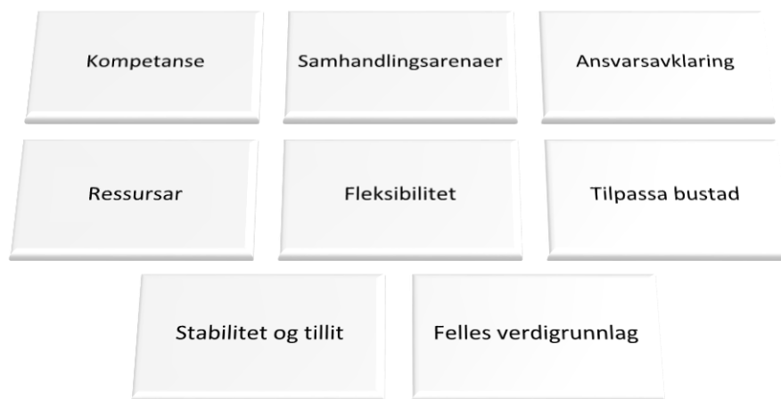
FIGUR 6 VISER SAMORDNING AV BUSTADSOSIALE TENESTER FOR MENNESKE MED SAMTIDIG RUSLIDING OG PSYKISK LIDING SYNEST Å VERE SOM Å LEGGE EIT PUSLESPEL. FIGUREN VISER VIKTIGE FAKTORAR SOM PÅVERKAR SAMORDNING AV BUSTADSOSIALE TENESTER FOR MENNESKE MED SAMTIDIG RUSLIDING OG PSYKISK LIDING (ROP-LIDINGAR). I BOTNEN LIGG UTVIKLING AV FELLES VERDIGRUNNLAG, HALDNINGAR OG PRINSIPP FOR DET BUSTADSOSIALE ARBEIDET. GRUNNLAGET FOR SAMORDNING AV BUSTADSOSIALE TENESTER VIL VIDARE VERE EIN TILPASSA BUSTAD, FLEKSIBILITET I HJELPETILBODET OG STABILITET OG TILLIT I MENNESKELEGE RELASJONAR. KOMPETANSE, RESSURSAR, ANSVARSAVKLARING OG SAMHANDLINGSARENAER ER FAKTORAR SOM FREMJAR OG HINDRAR SAMORDNING AV SLIKE TENESTER I KOMMUNEN OG MELLOM KOMMUNEN OG ANDRE INSTANSAR. VIKTIGHEITA AV FAKTORANE ER IKKJE RANGERT I FIGUREN.

I eit nedanfrå-og-opp perspektiv må ein ta i bruk forhandlingar mellom ulike aktørar som kan setje i verk vedteken politikk, bygge nettverk til desse og inngå kompromissar for totalt sett å nå måla på best mogleg måte. Tradisjonelt har diskusjonen om samordning innafor det bustadsosiale feltet dreidd seg om formelle strukturar og organisering. Ei undersøking knytt til samordning av bustadsosialt arbeid for menneske med samtidig rusliding og psykisk lidning viser at samordning for denne gruppa er mykje meir enn det. Det handlar i stor grad om «mjuke verdier», om å starte med enkeltmenneska og deira behov og ut frå dette få mange brikkar på plass (sjå figur over):