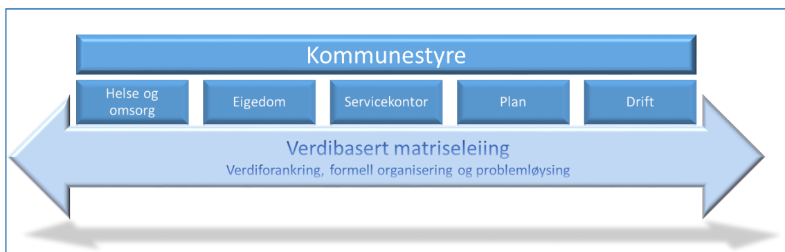
FIGUR 4 VISER EIN MODELL FOR VERDIBASERT MATRISELEIING I KOMMUNANE. MÅLSETJINGA MÅ VERE EIN KONTINUERLEG KOORDINERING AV DET BUSTADSOSIALE FELTET. VÅRE ERFARINGAR VISER AT EI SLIK VERDIBASERT MATRISELEIING KAN NYTTE VERDIFORANKRING, FORMELL ORGANISERING OG PROBLEMLØYSING SOM KOORDINERANDE ELEMENT.

I ei langsiktig koordinering på tvers meiner vi at dei verdibaserte elementa vil vere viktigare i matriseorganisasjonen enn i linjeorganisasjonen sidan dei ikkje i like stor grad er støtta av formelle struktur. Verdigrunnlaget for det bustadsosiale arbeidet legg føringar både for måla med arbeidet og for måten arbeidet skal drivast på. Eit felles verdigrunnlag bør vere forankra både politisk og administrativt i kommunen, og helst også formidla til aktørar som kommunen samarbeider med i det bustadsosiale arbeidet. Relevante spørsmål for matriseleiinga er: Kva vil vi oppnå med det bustadsosiale arbeidet? Kva skal prege tenestene? Korleis skal vi jobbe? Kva haldning skal vi ha til menneske som er omfatta av bustadsosialt arbeid? For å kunne skape eit felles verdigrunnlag i kommunen, må det etablerast ei felles forståing av kva bustadsosialt arbeid er, og av kva rolle ulike tenester har i arbeidet. Denne forståinga må også vere forankra hos politikarane, og helst også hos aktørar utanfor kommunen som er viktige i det bustadsosiale arbeidet.