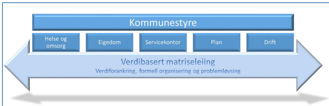
FIGUR 1 VISER EIN MODELL FOR VERDIBASERT MATRISELEIING I KOMMUNANE. MÅLSETJINGA MÅ VERE EIN KONTINUERLEG KOORDINERING AV DET BUSTADSOSIALE FELTET. VÅRE ERFARINGAR VISER AT EI SLIK VERDIBASERT MATRISELEIING KAN NYTTE VERDIFORANKRING, FORMELL ORGANISERING OG PROBLEMLØYSING SOM KOORDINERANDE ELEMENT.

Våre refleksjonar rundt matriseleiing kan illustrerast gjennom modellen over. I verdibasert matriseleiing vert arbeid målretta og koordinert på tvers av administrative og politiske strukturar i kommuneorganisasjonen gjennom: 1. Verdiforankring 2. Formell organisering og 3. Problemløysing. Bakgrunnen for dette er at vår erfaring med slikt arbeid tilseier at: