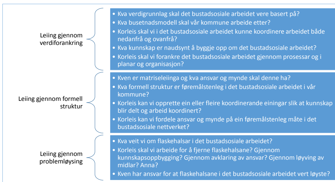
FIGUR 9 SUMMERER OPP SPØRSMÅL MATRISELEIINGA MÅ TA STILLING TIL INNAFOR OVERSKRIFTENE VERDIFORANKRING, FORMELL STRUKTUR OG PROBLEMLØYSING.

«Verdibasert matriseleiing» er ikkje eit ferdig utvikla konsept. Vi har valt å løfte fram matriseleiing nettopp fordi det er lite kunnskap om det, fordi det viser seg å vere avgjerande for kommunane i det bustadsosiale arbeidet, fordi det er stort behov for at «nokon» koordinerer innsatsen i ein kommune og fordi nettverksleiaren (prosjekt- eller programleiaren) ikkje kan gjere dette åleine i ein samansett organisasjon.