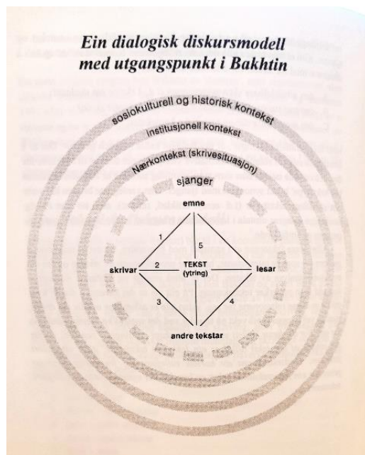
Figur 2 Ein dialogisk diskursmodell med utgangspunkt i Bakhtin (Dysthe, 1997)

Ut i frå Dysthe (1997) si lesing av Bakhtin har ho utforma tre relasjonar som er viktige i skrivinga (Figur 2): 1) relasjon mellom skrivaren og emnet, 2) relasjon mellom skrivaren og lesaren og 3) relasjon mellom andre tekstar og den framveksande teksten (Dysthe, 1997, s. 54). Forholdet mellom skrivaren og emnet handlar om at ingen idear blir tenkt ut heilt utan påverknad frå andre, men blir påverka av den sosiale konteksten skrivaren inngår i. Relasjonen mellom skrivaren og lesaren handlar om å vere mottakarbevisst. Ein må då vere merksam på korleis det ein skriv vil bli motteken av ein lesar. Meininga oppstår når skrivaren og lesaren møtest og byrjar å dele på teksten (Nystrand, 1997, s. 134). Tekstar får dermed si meaning når dei blir lesne (Nystrand, 1997, s. 134). Skrivaren må difor tenkje gjennom