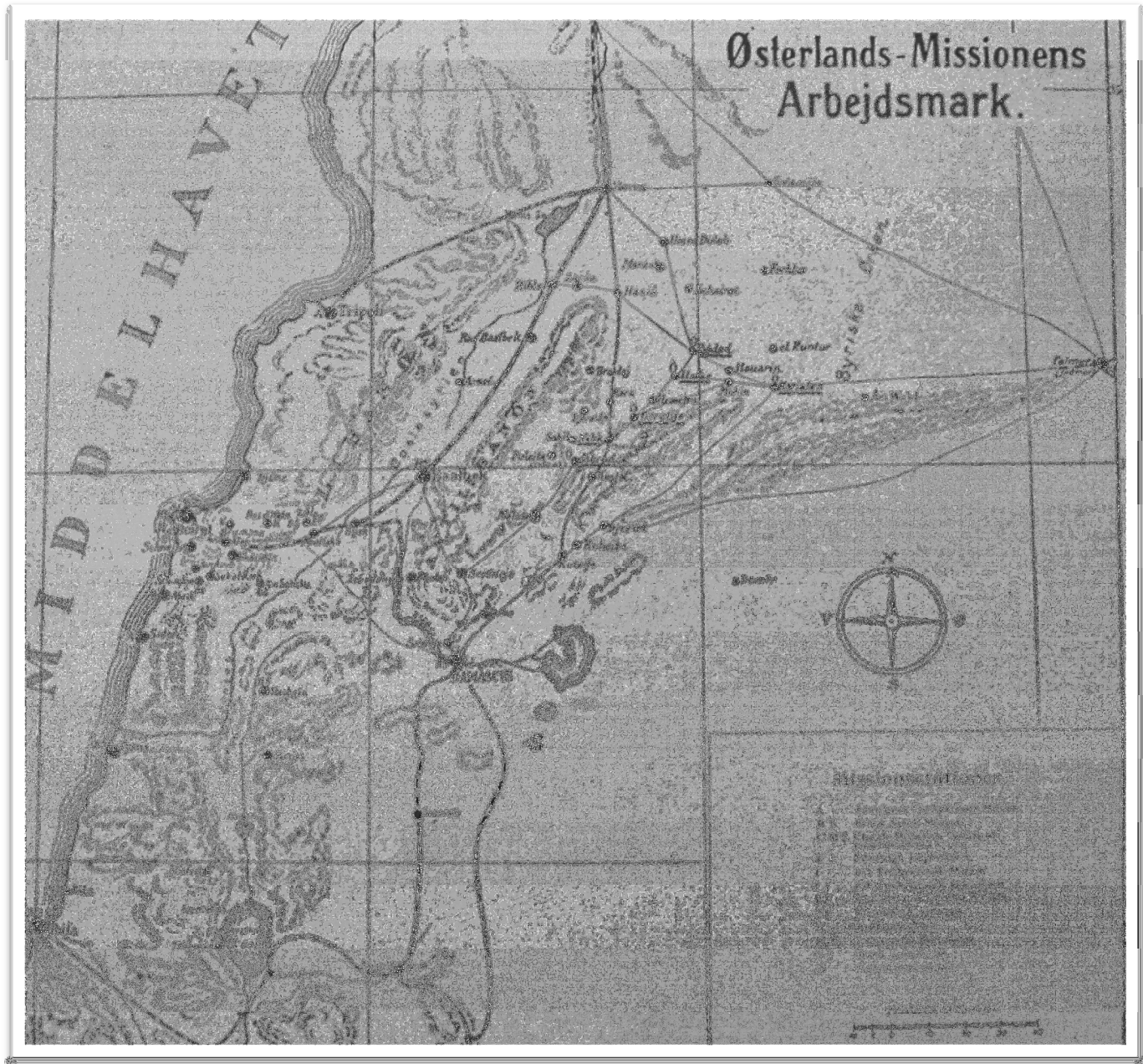
Kart over ØMs «arbejdsmark», Østerlandsmissionen, arkivnr. 10.065