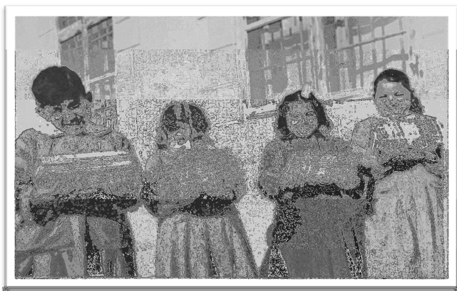
Elever ved Østerlandsmisjonens misjonsskole

Midt i September kom der en dag en Udsending fra Gendarmøversten med Forespørgsel, om vi kunde tage hans to Smaapiger ind i Skolehjemmet. Han er Muhammedaner, ganske ny i sit Arbejde her i Nebk, og «han vilde have Børnene i den bedste Skole» 209 .