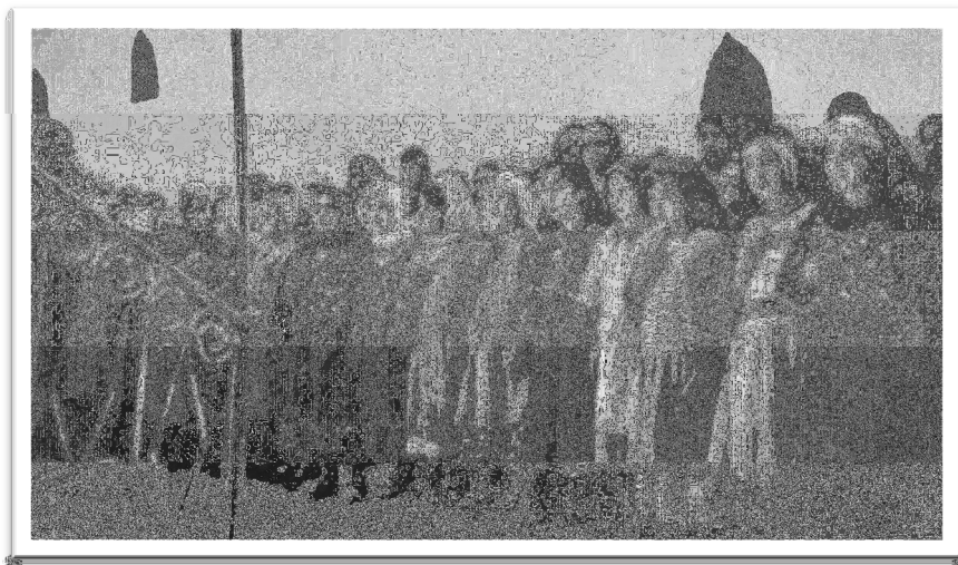
Elever under morgenandachten ved ØMs misjonsskole, Østerlandsmissionen, arkivnr. 10.065

Syria ble endelig evakuert våren 1946. Det at Syria ikke lenger ble kontrollert av franskmennene fikk konsekvenser for ØM. Dette ville først påvirke skoledriften og så senere sykehuset.