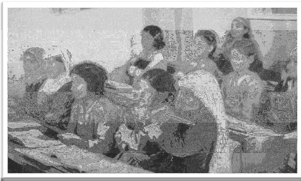
Elever fra ØMs pikeskole i en skoletime, Østerlandsmissionen, arkivnr. 10.065

Snellers skole hadde en klar pedagogisk og teologisk agenda og var et eksempel på pietistisk pedagogikk, troen var dominerende i alle pedagogiske felt 312 . Dette var noe som også var tilfellet i ØMs skoler, lærerinnene hadde skolens mål for øye, som i følge Skule var, å lære Jesus å kjenne 313 .