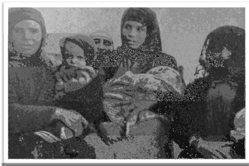
Syriske kvinner og deres barn, «Evangeliet til Islam, Mai-Juni 1974, Østerlandsmissionen, arkivnr. 10.065.

En af Orientens Grundskader er, at det hverken har ordentlige Mødre eller Husmødre. Ogsaa i den kristne Befolkning, hvor Evangeliets Indflydelse endnu ikke ret har gjort sig gældende, er Kvindens Stilling, paa Grund af hedenske Traditioner og muhammedansk Paavirkning, meget forrykt 258 .