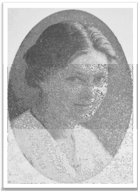
Skule i «Libanons Herlighed», 1925: 33

I mitt kildemateriale har jeg funnet kilder som kan antyde at Skule muligens ikke var like